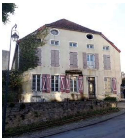
Avant les travaux

Voici quelques photos pour suivre les travaux.