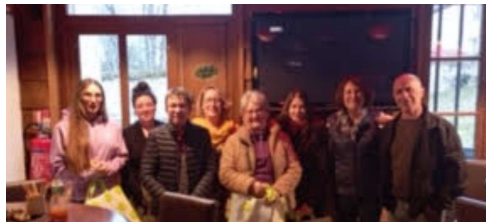
Les participants au concours photo

Leur première action a été d'organiser un concours photos afin d'avoir des clichés pour relancer la communication et pouvoir partager de belles images avec les futurs touristes.